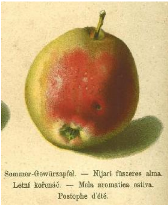
R.Stoll 1888 Pomologie en Autriche.